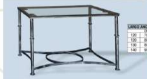
modelo M.F. 202 (Óvalo)