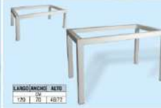
modelo M.F. 205