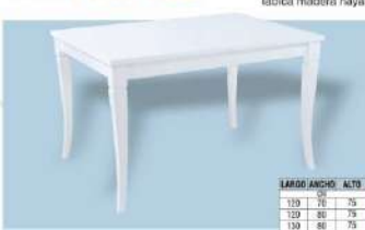
modelo M.V. 102

Madera de haya Tablero 18 mm. Patas 60 x 60 mm. Doble embolo Tablica madera haya