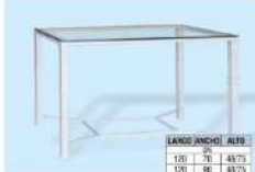
modelo M.F. 203