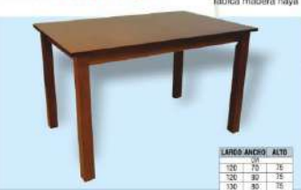
modelo M.V. 101

Madera de haya Tablero 18 mm. Patas 60 x 60 mm. Doble embolo Tablica madera haya