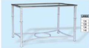
modelo M.F. 201